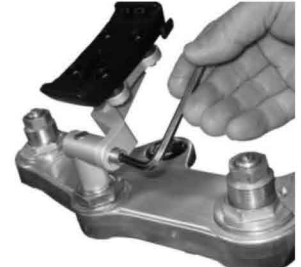
NL : Stel de hellingshoek in en draai de bout aan. (max. 10Nm) GB : Adjust the viewing-angle and tighten the bolt. (max. 10Nm) D : Gewünschten Blickwinkel einstellen und die Schraube mit max. 10Nm anziehen.