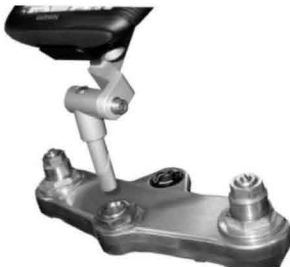
NL : Schuif de steun in het gat van de balhoofdpen. GB : Insert the mount into the hole of the steering stem. D : Halter in die Bohrung des Lenkkopfrohrs einführen