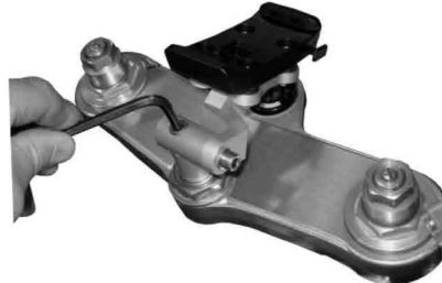
NL : Richt de steun uit en draai de bout aan. (max. 10Nm) GB : Straighten the mount and tighten the bolt. (max. 10Nm) D : Halter gerade ausrichten und die Schrauben mit max .10Nm anziehen.