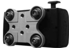
NL : Draai de moeren vast. GB : Tighten the nuts. D : Muttern aufschrauben.