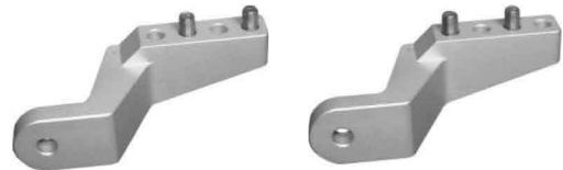
NL : Kies de gewenste positie, max. 5Nm GB : Select the desired position, max. 5Nm D : Wählen Sie die gewünschte Position, max. 5Nm