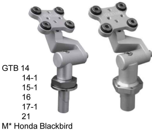
GTB 14 14-1 15-1 16 17-1 21 M* Honda Blackbird