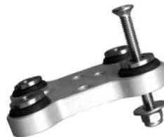
NL : Monteer de bouten en ringen volgens de afbeelding. Gebruik de bouten die bij uw GPS-systeem bijgeleverd zijn. GB : Fit the bolts and washers according to the drawing. Use the bolts provided with your GPS-system. D : Montieren Sie die Schrauben und Unterlegscheiben anhand der gezeigten Abbildung. Verwenden Sie die Schrauben, die bei dem GPS-System mitgeliefert werden.